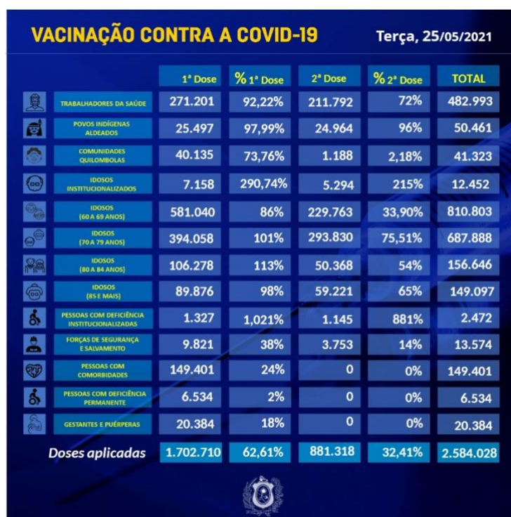
Quadro 2. Cobertura vacinal segundo grupos prioritários em Pernambuco.